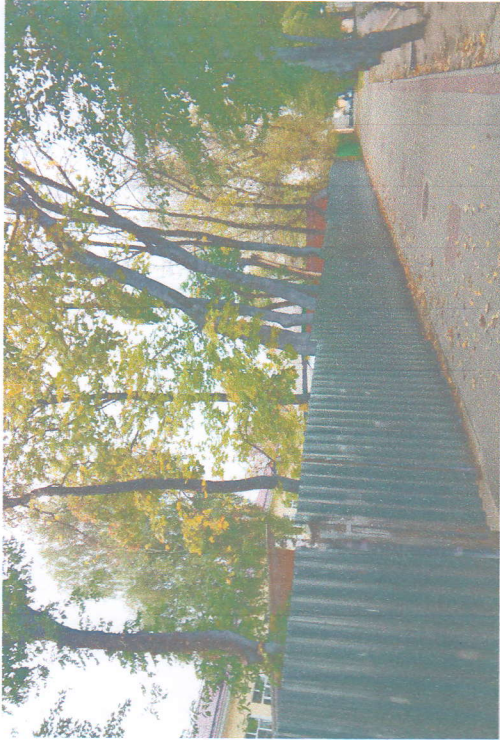
Фото на странице: 0